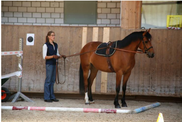
Gymkhana am langen Zügel